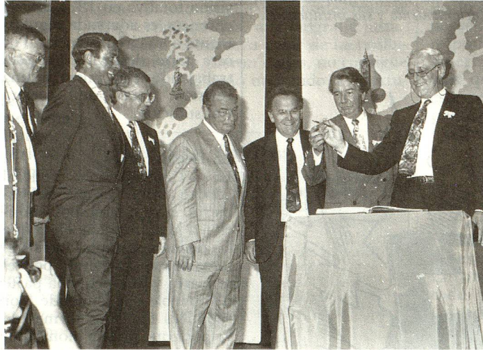
Todos los Consejeros Federales inscriben su nombre en el libro de visitantes.

Europa. Teniendo en cuenta las decisiones históricas que los suizos deberán tomar, instó a los suizos del extranjero a que hicieran uso sistemático de su nuevo derecho de voto por correspondencia y a dar el ejemplo a los ciudadanos residentes en el país con una gran participación.