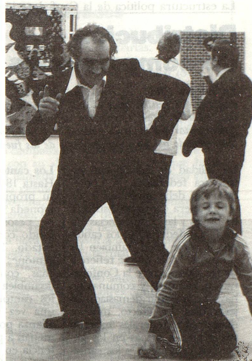
Jean Tinguely. Los niños eran su público preferido.

La fuerza hidráulica, el chico de catorce años la había utilizado primero para mover la rueda provista de dos docenas de martillos o casi, y tal vez hubiera permanecido en la fuerza hidráulica si hubiera podido llevarse consigo sus experiencias cinéticas. Para sus «Moulin à prière» utilizó luego una manivela y a veces un movimiento de relojería y, más tarde, sobre todo el motor eléctrico. Desde 1960, el agua tuvo nuevamente un gran papel en sus fuentes o máquinas de agua, como Tinguely las llamaba, al igual que el fuego, que formaba parte de sus máquinas desencadenando un proceso de autodestrucción. Logró mismo hacer coexistir ambos elementos contrarios en fuegos artificiales submarinos en el mar de Estocolmo. Con