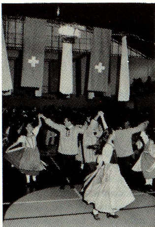
Grupo de Danzas Folkloricas Sueños Alpinos

un entusiasmo digno de elogio, se presentan en cuanta reunión o manifestación típicamente suiza que solicita su colaboración.