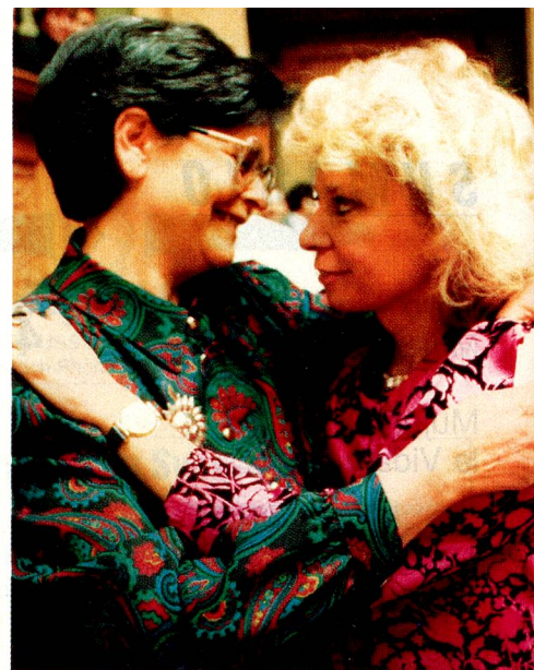
Christiane Brunner (izqu.) felicita a su «gemela política» Ruth Dreifuss por su elección al Consejo Federal.

Una mujer vuelve a ocupar uno de los siete puestos del Consejo Federal, más de 20 años después de la implementación del derecho a voto femenino. La elección de Ruth Dreifuss, afiliada al Partido Socialista, al cargo más alto en nuestro gobierno marca un punto de transición en la larga marcha de las mujeres al poder político. Porque por primera vez, han acelerado su manera de proceder.