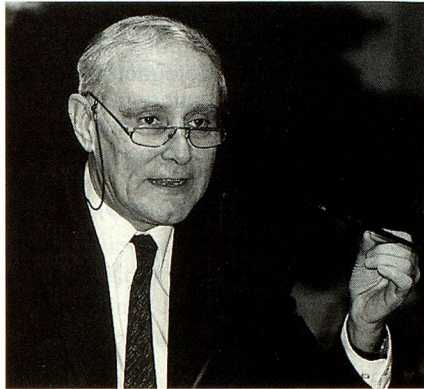
Desde esta primavera, Flavio Cotti del Tesino es el nuevo Jefe del Departamento Federal para Asuntos Exteriores (DFAE).

Desde muy niño, sus pasos siguieron los de su ideal, Giuseppe Motta, consejero federal desde 1912 hasta 1940 y uno de los ministros de relaciones exteriores más importantes de Suiza. Al igual que Motta, oriundo del Tesino, Cotti estudió en el Collegio Papiro de Ascona y en la Universidad de Friburgo, fue miembro de la Sociedad de Estudiantes Suizos y del Partido Democrático-cristiano Suizo (PDC), fue abogado y notario, consejero mayor, Presidente del partido cantonal, consejero nacional y consejero federal.