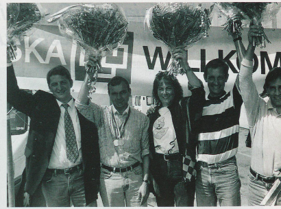
...y los jinetes.

para los deportistas profesionales. Sobre decir, que esto no alcanza para que los atletas puedan ser aún más profesionales. Un análisis ha demostrado que actualmente en Suiza las ventas relacionadas con el deporte ascienden a entre 16 y 18 billones de francos. ¡Ahora hasta está de moda ponerse zapatos tenis para andar en la ciudad! La influencia del deporte en la moda de tiempo libre es enorme; pero también en la hotelería, etc. Me parece justo que el comercio y la industria sigan contribuyendo para que podamos apoyar cada vez mejor al deporte, del que tan ampliamente se sirven para propagar sus servicios y productos.