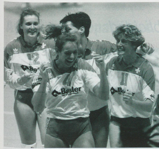
Nos alegraron: las jugadoras suizas de Volleybal...