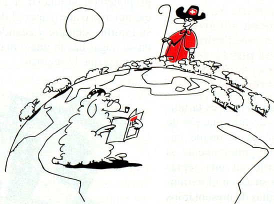
(Dibujo: Hugo Bossard)

dez congénita, enfermedades o accidentes primero hay que tratar de reintegrarse a la sociedad antes de tener derecho a cobrar una renta. Sólo cuando está comprobado que es imposible rehabilitarse o que sólo es posible parcialmente, hay derecho a renta.