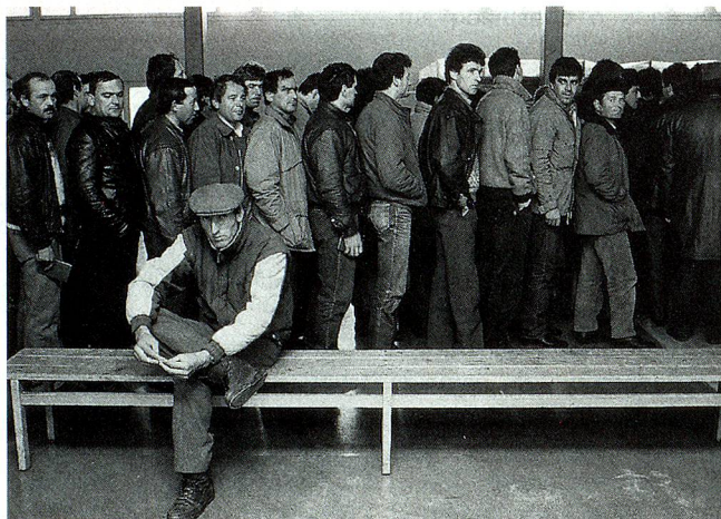
Trabajadores temporeros al pasar la frontera en Buchs, SG: en Suiza siempre hay quien trate de limitar el número de extranjeros.

Infórmese en: DER FONDS, Gutenbergstrasse 6, CH-3011 Bern