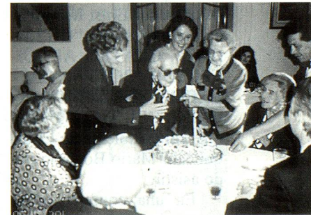
La homenajeadá soplando el velón de su centenario, rodeada de compatriotas y amigos.