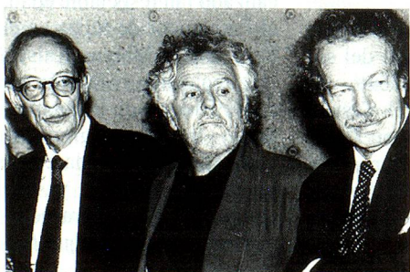
Los tres arquitectos que asistieron a la Exposición.