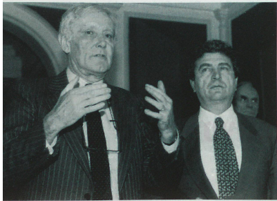
Flavio Cotti con el Primer Ministro Hasan Muratovic de Bosnia.

Nuestro Assistance Group se mudó a una casa que, a pesar de quedar muy cerca del centro y de la gran destrucción circundante, había quedado relativamente intacta. Este aposento es típico para el norte del Cáucaso y consistió de dos casas pequeñas con una galería que nos sirvió de cocina, sala y estudio desde el verano hasta el invierno. Aunque la casa tenía ventanas, no tenía puertas. Estaba equipada con un poco de gas y una tubería de agua en el patio que esporádicamente surtía agua, pero no