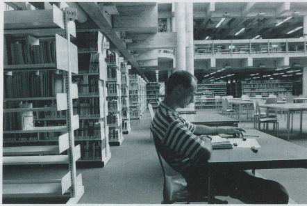
En 1997: primeras escuelas técnicas superiores