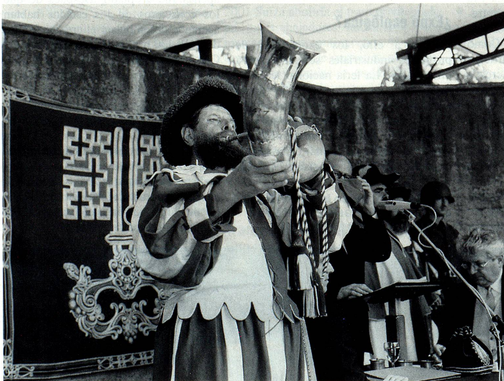
Esta imagen pertenece al pasado. En Nidwalden ya no hay Landsgemeinde.

La participación de votantes más bien baja del 47% demuestra que el debate sobre la abolición de la Landsgemeinde ni siquiera causó furor en Nidwalden. Actualmente aun existe la Landsgemeinde en los siguientes cantones: los 2 Appenzell, Glarus y Obwalden. ■