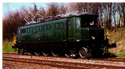
Ae 4/7 (fabricación: 1927-1934)