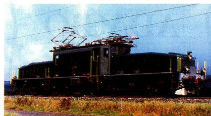
Ce 6/8 (fabricación: 1921-1927)