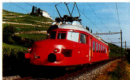
RAe 2/4 (fabricación: 1935-1938)