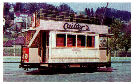
Ce 1/2 (fabricación: 1888)

Suiza es uno de los países que tienen la red ferroviaria más densa del mundo. Esta red está complementada por la excelente red que abarca los demás medios de transporte público tales como autobuses del correo, tranvías y buses, barcos, funiculares y teleféricos. Las y los suizos están acostumbrados a montar en tren. Suiza le sigue al Japón en cuanto a cantidad de viajes en tren por habitante y la SBB encabeza las empresas ferroviarias europeas con su participación del 13.5% de kilómetros/persona y del 38.5% de kilómetros/mercancía.