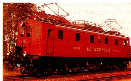
Be 5/7 (fabricación: 1913)