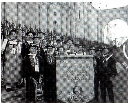
Grupo folclórico "Helvetia" en la Plaza de Armas de Arequipa, Perú.

Veinte integrantes del Grupo Folclórico Suizo "HELVETIA", junto con otros provenientes de distintos países, así como por supuesto con grupos peruanos, participaron en el XVII Festival de Danzas Folclóricas FESTIDANZA '97, que tuvo lugar en Arequipa, Perú, del 16 al 19 de agosto.