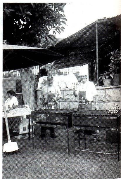
Presidente y Vicepresidente del Club a cargo de la Parrilla y ... Cerveza.