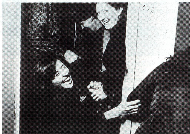
Integrantes del Conjunto Aleph

EXTRAÍDAS DE UN TEXTO DE LA SEÑORA ALEXANDRA FERNÁNDEZ SCHWALM