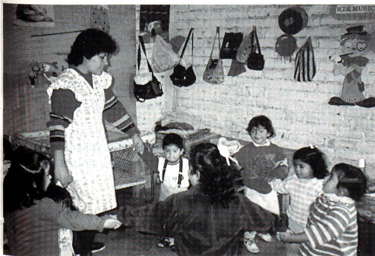
Madre Educadora atendiendo a los niños que le son confiados en el seno de un Hogar Educativo.

El galardón recibido es pues más que merecido por la gran obra que realiza la benemérita institución Asociación Taller de los Niños en los distritos carenciados de Lima. ■