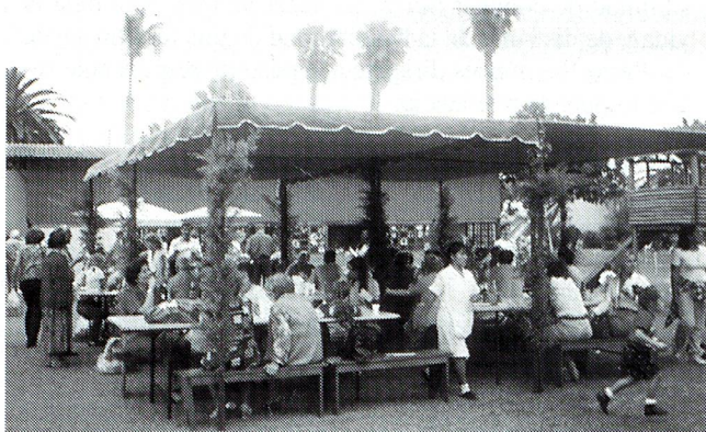
Uno de los buenos momentos de la Fiesta.

Como es tradición, el último sábado de noviembre, organizamos en el Club Suizo el "Bazar de Navidad", en donde por una módica contribución se puede entrar y comprar artículos navideños o Coronas de Adviento, todo hecho por las Damas Suizas, las que durante el año han estado trabajando para esto. ¿Ya compraron?, ¿contentos?, ahora, si camina un poco encuentra el kiosco de la Tómbola (siempre lleno de gente), con todos los números premiados. Los premios son donaciones de firmas suizas o amigos de la colonia. Con tanta caminata se llega al fin a una deliciosa cerveza helada a la que acompañamos con un "Brattwurst" con "Kartoffeln salat". Ya satisfechos llegamos al "Kafistubli", novedad de este año, Nescafé donado por Nestlé y tortas y galletas navideñas hechas por las Damas Suizas. De aquí podemos ver juegos para niños y adultos, todos con premios.