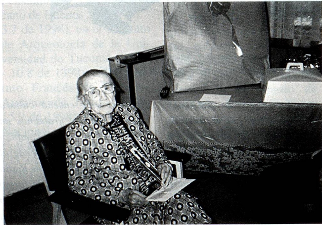
La homenajada rodeada de algunos de los regalos recibidos.