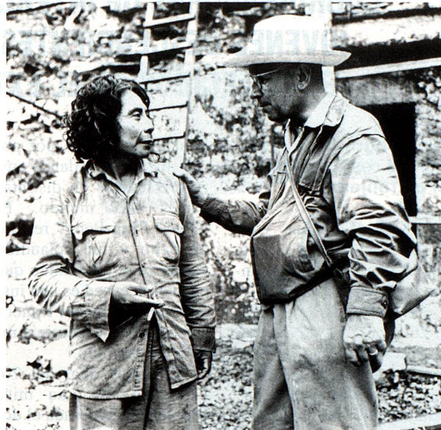
Alfred Métraux entre los Lacandones, México

El etnólogo Alfred Métraux nació en Lausanne en 1902. Su padre, también de nombre Alfred, era cirujano y vivió más de cuarenta