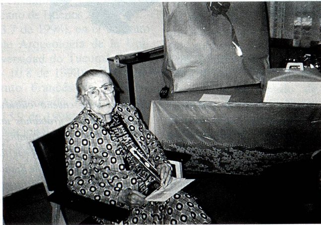
La homenajada rodeada de algunos de los regalos recibidos.