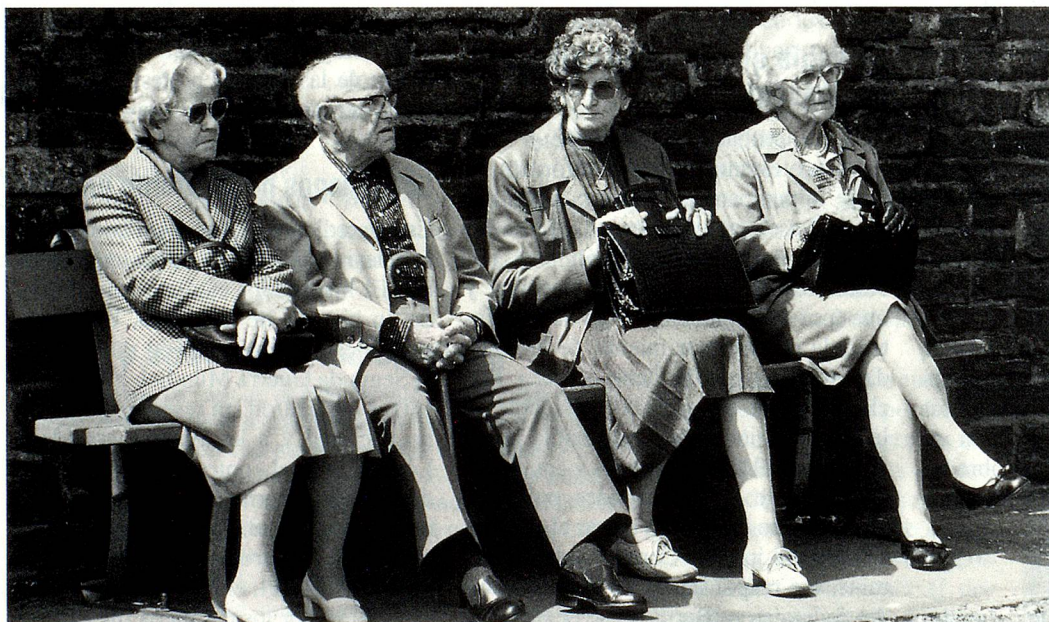
Aún tienen segura su renta de vejez. ¿Pero la tendrán también en el año 2010?

Actualmente, los hombres se jubilan a los 65 años de edad y según la 10ª revisión del AVS que aceptamos hace algunos años, la edad de jubilación de las mujeres subirá de 62 a 64 años (a partir del año 2005). Se está analizando también si es factible modificar las rentas, v.g. aumentar las rentas mínimas, disminuir las máximas, combinar las dos variantes y ajustar más o menos rápidamente las rentas al aumento del costo de vida. Cualesquiera ajustes que se le hagan a la 1ª columna (AVS/AI) podrían conllevar ajustes a la 2ª (cajas de pensión) tales como mejorar los beneficios para quienes devengan salarios bajos y