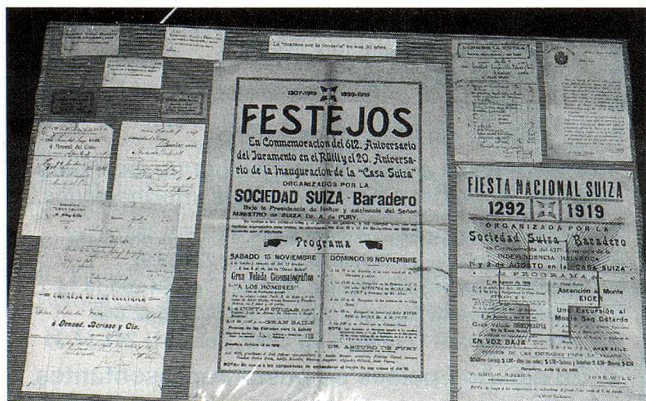
Detalle de la Exposición de los Archivos de la Sociedad Suiza de Baradero

Esta Exposición, evocativa de la historia de los colonos friburgueses en Baradero tendrá además un aspecto de acercamiento fraternal ya que está previsto el viaje a la Argentina de un grupo de suizos dentro del marco de las conmemoraciones del Centenario de la Casa Suiza de Baradero.