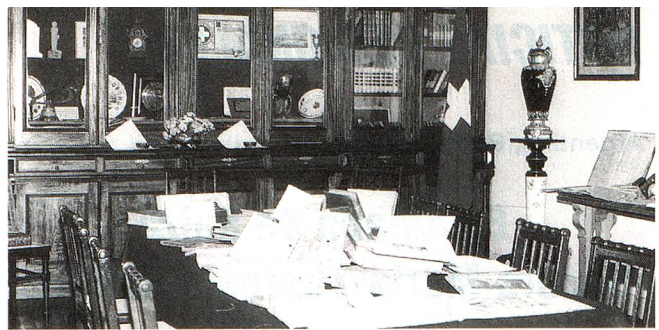
La Biblioteca casi centenaria de la Casa Suiza de Baradero

En otro orden de cosas, continúan las clases de francés, alemán y portugués en las cómodas aulas de la Es-