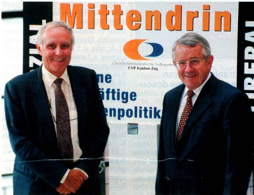
Se retiran los consejeros federales Flavio Cotti y Arnold Koller (de izquierda a derecha).

Fueron elegidos juntos hace doce años. Ahora, los consejeros federales del PDC Arnold Koller (65) y Flavio Cotti (59) se retiran conjuntamente al 30 de abril de 1999. Esta vacancia doble e inesperada allana el camino a una segunda consejera federal.