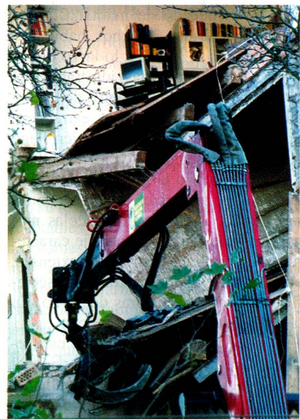
Textos: Alice Baumann

Una grave explosión de gas en Berna le costó la vida a 5 personas. La explosión, hizo que el edificio de apartamentos de 6 pisos en cuya planta baja había un taller mecánico, ubicado en el eje de tránsito Nordring, se derrumbara como un castillo de naipes. Se cree que fue una tubería de gas rota la que causó el siniestro. ■