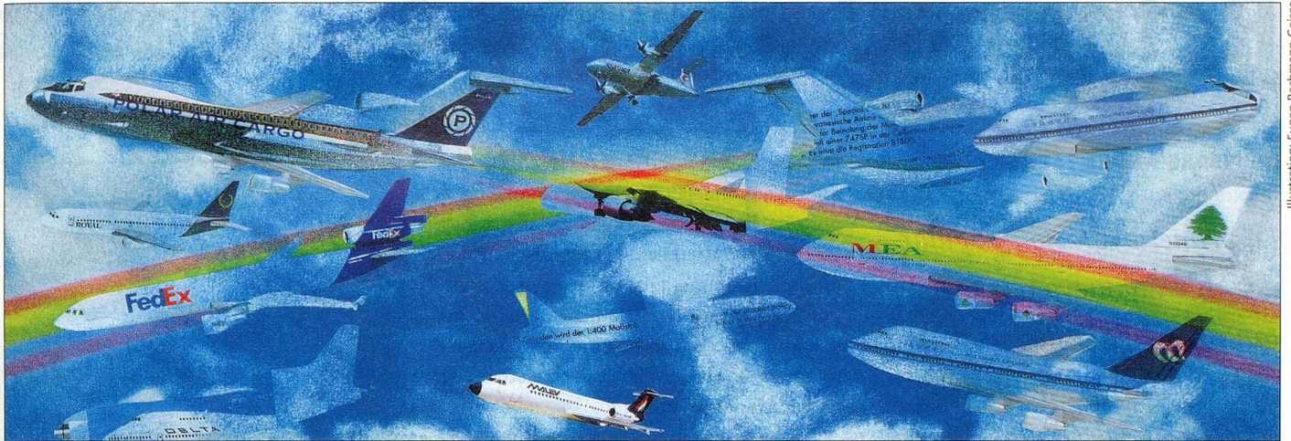
Illustration: Eugen Bachmann-Geiser

Los retrasos y los embotellamientos contribuyen a situaciones caóticas en el tráfico aéreo.