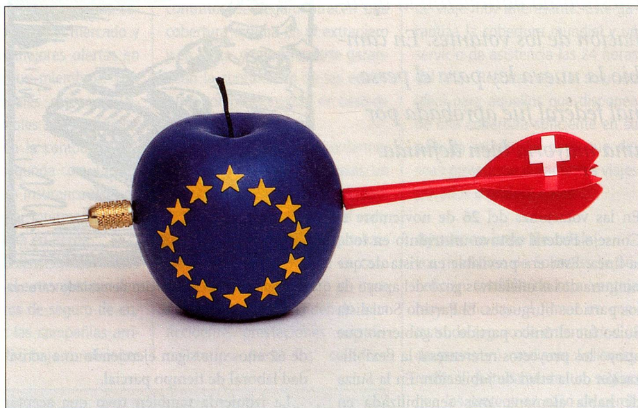
Los elementos mitológicos serán presentes también durante la campaña de votaciones sobre la relación entre Suiza y la UE.

Para presentar esta iniciativa popular en la relación correcta, hay que recordar los momentos decisivos de la política europea de Suiza. Mayo de 1992: El Consejo Federal solicita el inicio de las negociaciones destinadas a ingresar a la UE. 6 de diciembre de 1992: En una votación federal el pueblo rechaza el ingreso de Suiza al Espacio Económico Europeo (EEE). Como consecuencia, el Consejo Federal congela la solicitud, pero establece como «meta estratégica» de su política europea el ingreso completo de Suiza a la Unión Europea y desea deliberar en Bruselas sobre la ampliación del Acuerdo de