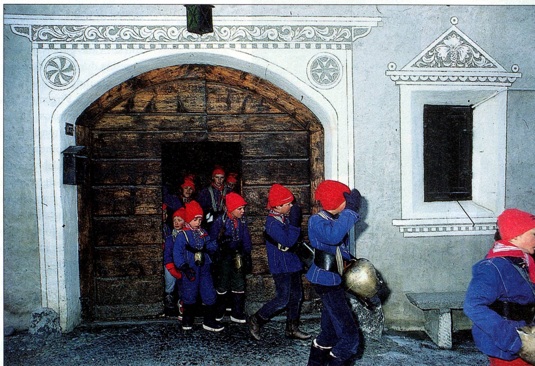
La «Chalanda Marz» anuncia la primavera al estruendoso son de las campanas.