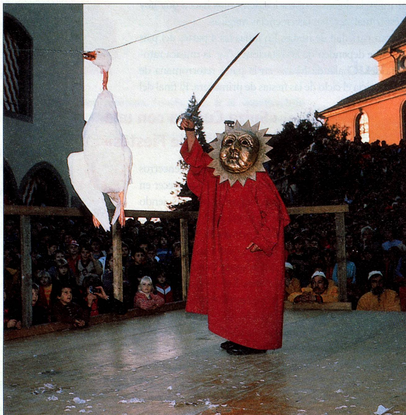
En Sursee, el día de San Martín se celebra el «Gansabhauet».

En las próximas páginas autores célebres analizan la fiebre de los suizos por las fiestas. Jocosamente nos relatan sus propias experiencias en cuanto a las usanzas y tradiciones de la región a la que se acercaron como turistas.