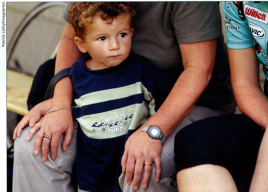
Las familias se aliviarían gracias a mayores descuentos por hijos.

El paquete impositivo fue decidido por el Consejo Federal en el 2001. Contiene tres