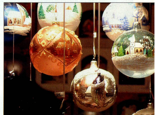
Adornos de Navidad – hechos por niños.