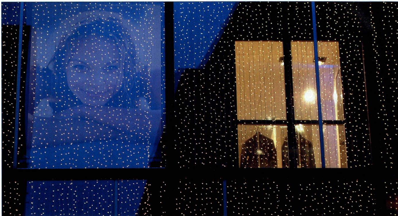
Las luces navideñas dan encanto a las casas y hacen brillar los ojos de los niños.