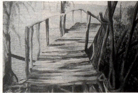
Luis César Bourband, “Muelle al río”