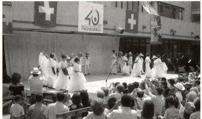
Los "Jarochitos" bailan la "Bamba", típico baile del Estado de Veracruz

Dos años después, el Colegio contaba con un amplio y funcional edificio, para mayor población estudiantil, con espacios para deportes, incluida una piscina, laboratorio de idiomas y de química, sala de computación, biblioteca y un gran Auditorio para eventos culturales. Así fue creciendo hasta llegar al año 1971 en que se dio la posibilidad de impartir el nivel de Preparatoria dentro del sistema multidisciplinario de CCH (Colegio de Ciencias y Humanidades) y agregar la enseñanza de inglés y francés. De esta manera, lo que en un principio favoreció a niños suizos, fue cimen-