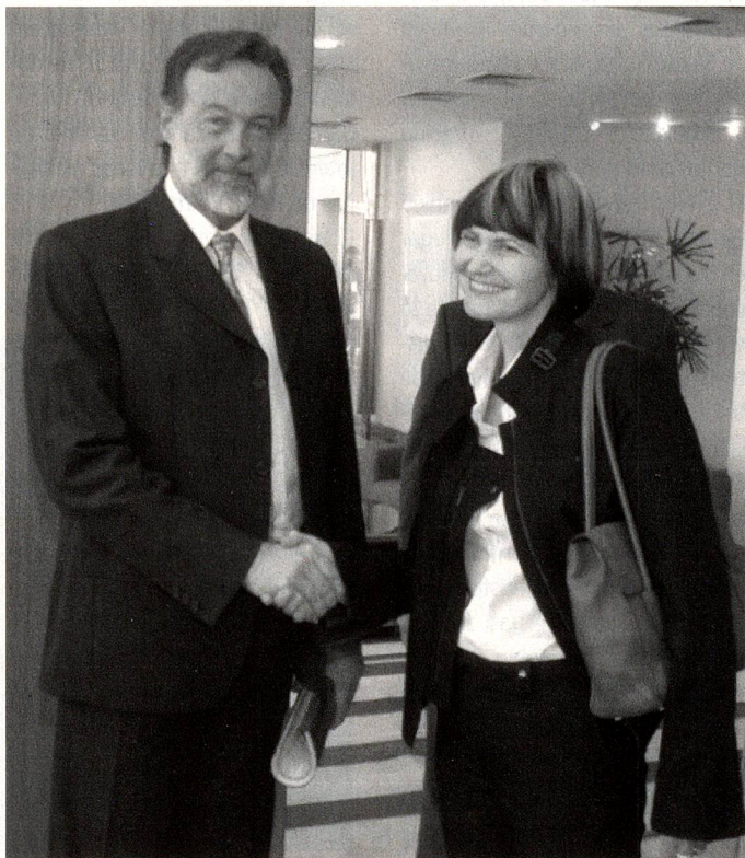
La Sra. Ministra con el Canciller Rafael Bielsa, en Bs. As.