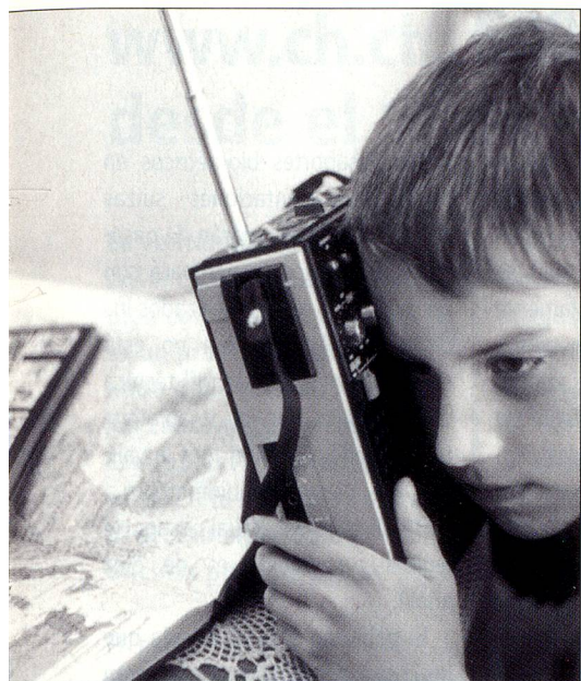
La onda corta deja de servir.

con la patria, antes acentuadamente emocionales, se atenuaron» (según el profesor Walther Hofer).