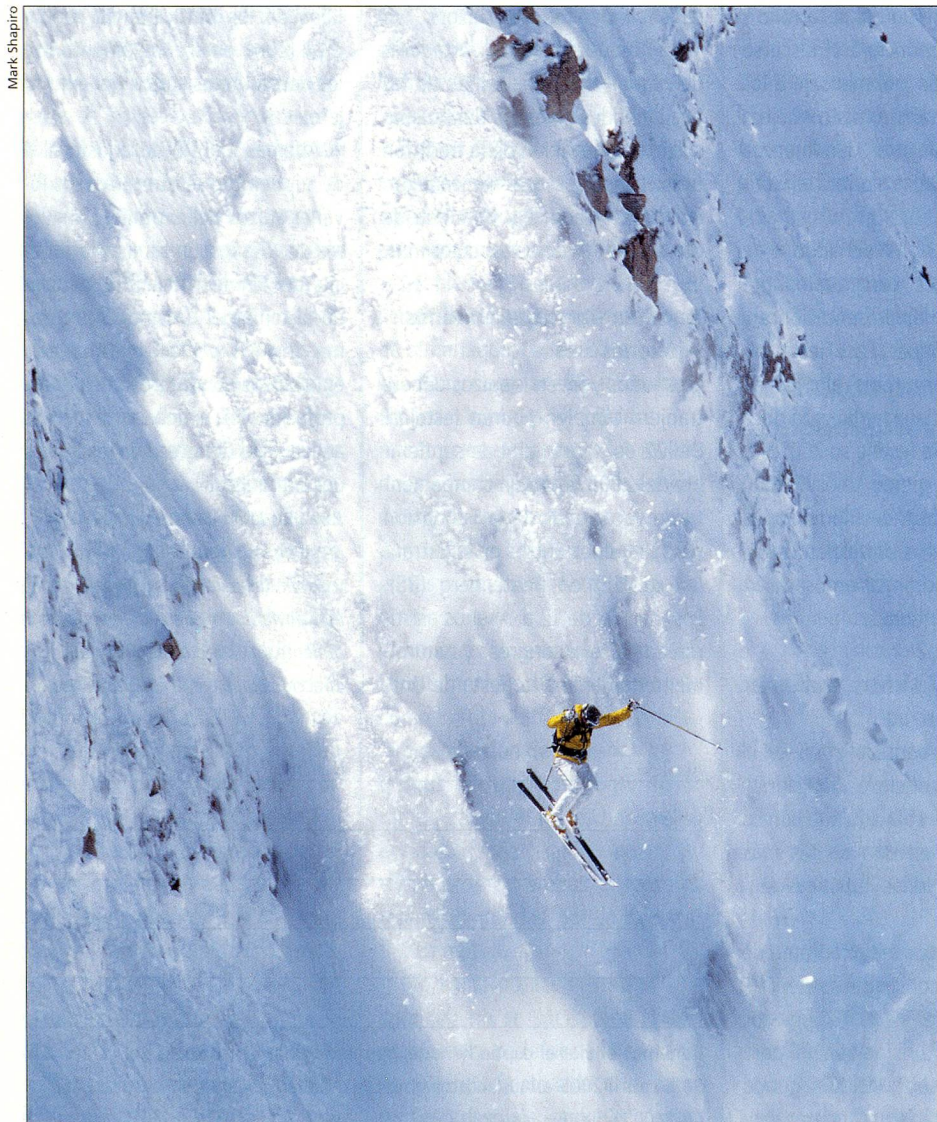
Dominique Perret dejó sus huellas en famosas pendientes muy empinadas.

Este excepcional esquiador ha dejado sus huellas en las más famosas cuevas empinadas del mundo. Se perfecciona permanentemente y se compromete con proyectos que lo hacen crecer y lo acercan a la integralidad total. En el año 1990 estableció, con 36,4 metros, el récord mundial de salto de peñasco con esquí, y al año siguiente alcanzó una velocidad máxima de 211,825 Km/h en Portillo, Chile. En 1996 emprende, con el guía alpino y aventurero valesino Jean Troillet, una expedición con la meta de bajar esquiando, del lado tibetano, la pared norte de monte Everest (8848 m) – con puro estilo alpino, es decir sin campamento ni máscara de oxígeno. Después de pasar tres meses en la zona y