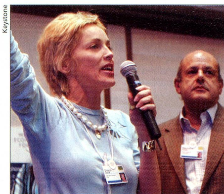
Sharon Stone en el WEF

26 de enero. Unos días después de las manifestaciones anti-WEF en Berna y Bienne, se inaugura el 34º Foro Económico Mundial en la quietud alpina de Davos. Este año el tema principal del evento, que duró hasta el 30 de enero, fue la «Solidaridad global». Los temas tratados fueron la pobreza, una globalización más equitativa, los cambios climáticos, la instrucción y educación, así como la forma de actuar de los gobiernos mundiales. En el transcurso del foro, los líderes de la economía mundial expresaron que la responsabilidad para iniciar pasos concretos está en las manos de la política. Por lo demás, el evento también estuvo caracterizado por la presencia de estrellas de Hollywood como Sharon Stone.