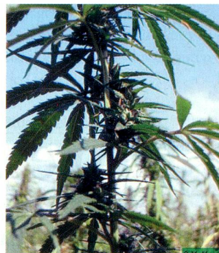
Cannabis, ¿pronto accesible a todos?

Según esta iniciativa, la Constitución debería contener un nuevo artículo 105a, que legalice