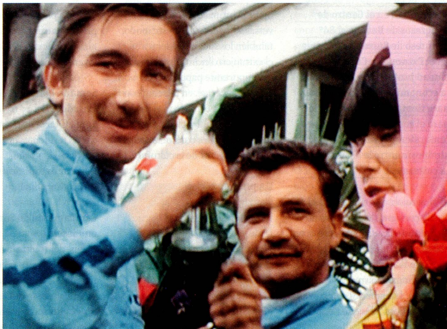
Joe Siffert en 1967, después de una carrera, con amigos, y en un cartel de cine (abajo).

necesitamos historias así. La valentía para afrontar riesgos es una cualidad positiva, hay que hacer las cosas con valor y entusiasmo.» En sus conversaciones con los familiares de Jo Siffert, a Men Lareida le llamó la atención algo que sucede muy raras veces: nunca oyó a nadie decir algo negativo de él.