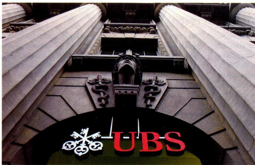
«Global Player» UBS: sede de la Bahnhofstrasse, Zúrich

¿Por qué realizan inversiones directas las empresas suizas? ¿Es una estrategia defensiva relacionada con problemas en el mercado interior? ¿O, más bien, una ofensiva para triunfar en el extranjero?