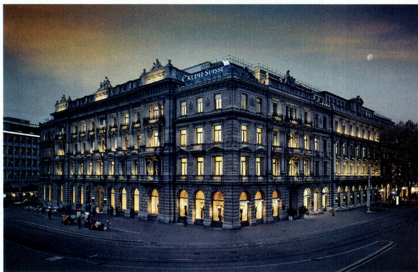
«Global Player» Credit Suisse: sede de Paradeplatz, Zúrich

El Banco Nacional Suizo registra estadísticamente las inversiones directas de la economía suiza en otros países (exportación de capital) y las inversiones extranjeras directas en Suiza (importación de capital). Según su definición, las inversiones directas ejercen una «influencia con-