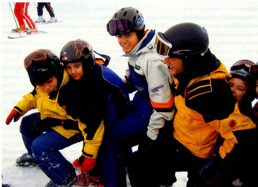
Campamento de invierno de SJAS en febrero de 2006.

Fundación para Jóvenes Suizos Residentes en el Extranjero Alpenstrasse 26 CH-3006 Berna Tel.: +41 31 356 61 16 Fax: +41 31 356 61 01 E-mail: sjas@aso.ch www.aso.ch (rúbrica jóvenes / colonias de vacaciones de 8 a 14 años / campamentos de invierno)