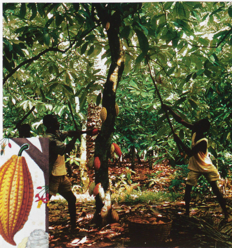
El cacao con el que se fabrica el chocolate suizo procede de Sudamérica y de África

Rudolf Lindt (1855-1909) abrió en Berna una fábrica de chocolate en 1879. Este minucioso e inventivo artesano perfeccionó su ma-