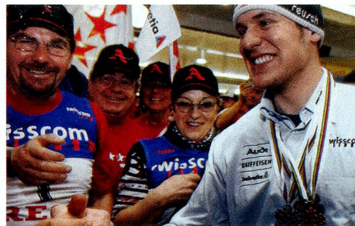
Daniel Albrecht, campeón mundial de esquí, con un grupo de aficionados

La Comisión Europea considera que las prácticas fiscales de algunos cantones suizos son «incompatibles» con el Tratado de Libre Comercio de 1972. Concretamente se refiere a las ventajas fiscales para empresas extranjeras, sobre todo de los cantones de Zug y Schwyz. Amenazada con represalias, Suiza se verá obligada a negociar. La prensa suiza critica la «presión» de Bruselas y considera que los argumentos aduci-