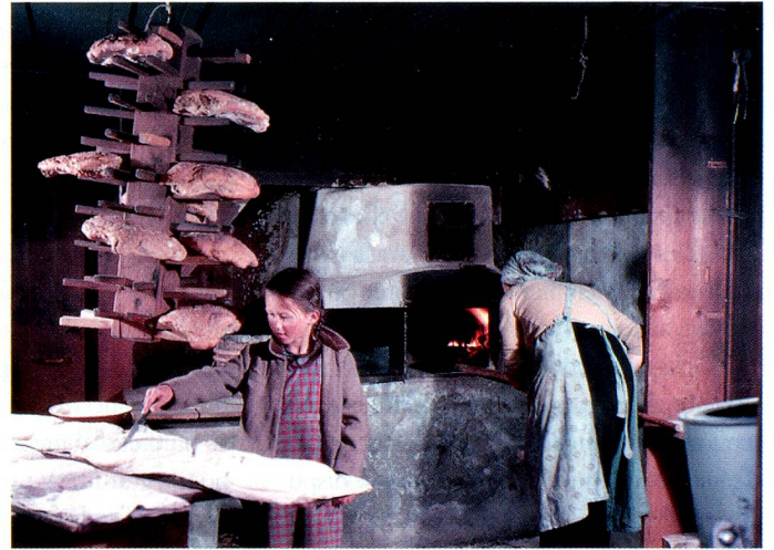
Horneando pan en Lugnez.