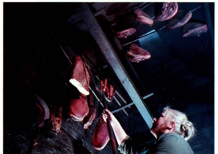
Chimenea borgeña, en el valle de Illier.