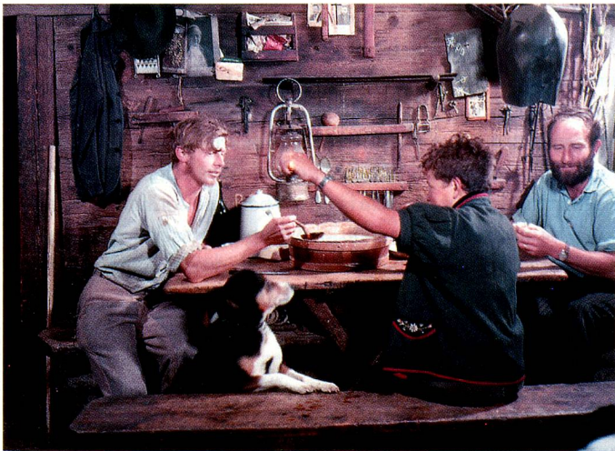
Suifi, Alpes de Gummen en Nidwalden.