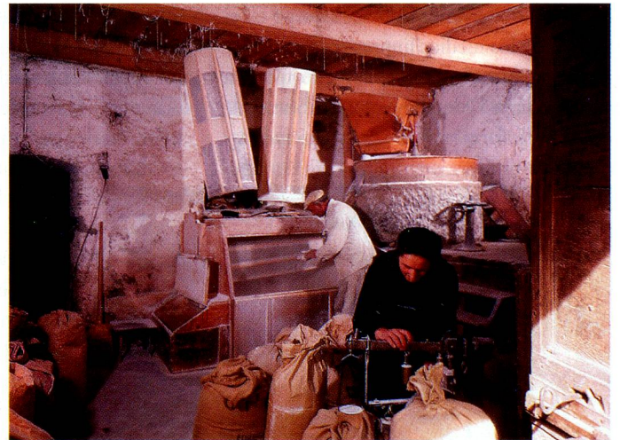
Molino de cereales en Poschiavo.