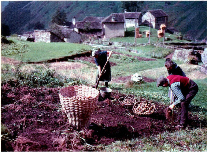
Recolección de patatas en Mabraglia.

La vida en la montaña. Peter Ammon (1924) es uno de los primeros fotógrafos suizos que ya en los años 50 hacía fotos en color de gran formato. A Peter Ammon, que entonces contaba 25 años, le fascinaba sobre todo la vida en las montañas suizas. Las 125 fotografías publicadas por primera vez en este libro muestran un aspecto de Suiza raramente documentado de esta forma. El libro cuesta 78 francos y está a la venta en las cuatro lenguas nacionales. www.aura.ch