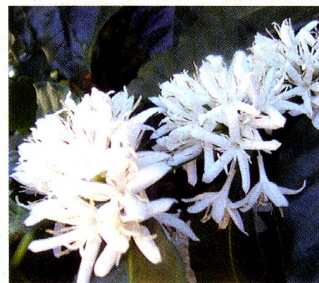
Flor del cafeto

Las pruebas revelaron la calidad de la esencia para usarla en cosméticos y la fragancia de las flores del cafeto - muy similar a