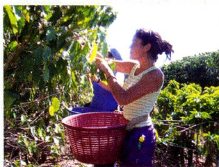
Cosecha de la flor

Joven, bella y de un talento admirable, con apenas 24 años de edad, Burki domina este instrumento de 3,70 metros de longitud y logra emitir hasta 16 to-