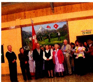
Los participantes cantan el Himno Suizo

Al finalizar la cena, fueron elegidos los "reyes mayores y principitos", quienes representaron a Suiza en la Fiesta Nacional del Inmigrante, que se realizó en el mes de setiembre, en esta ciudad. También fue pre-