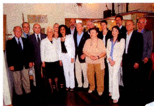
Miembros de la Comisión Directiva con la Sra. Embajadora