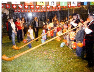
Los músicos con sus instrumentos y los niños con sus farolitos

Como todos los años, también hubo algo para los niños, el Mago Murga que impresionó con sus trucos a los asistentes. Después de la cena se realizó el tradicional desfile infantil de farolitos. Los niños participaron con