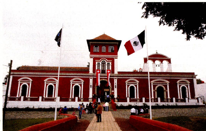
Fachada de la Hacienda de Panoaya - México

Con el fin de conmemorar la Fiesta Nacional de Suiza, el Club Suizo de Panamá llevó a cabo una fiesta campestre con fogata, paseo de lampiones, música bailable y comida típica suiza. La