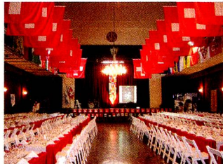
Salón Casa Suiza de Buenos Aires

bal Forwarding, Kuhne & Nagel, Laboratorios Roche, Minera Alumbrera, Nestlé, Novartis, Panalpina Transportes Mundiales S.A., Rolex, Walzen Suisse, Zannella y Zurich Seguros que hicieron posible este evento. Agradece particularmente al Sr. Spinedi por haber puesto a disposición la tradicional Casa Suiza, y a todo el personal de la misma.