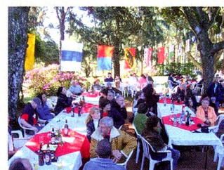
Fiesta patria en Caacupé

Cabe destacar el apoyo de las empresas suizas con presencia en