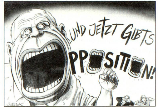
El ex consejero federal Christoph Blocher en su antigua/nueva función. El caricaturista Peter Schrank en el Basler Zeitung