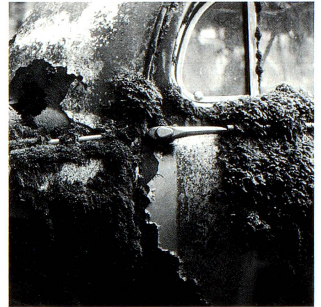
Cementerio de coches de Gürbetal, BE (página 7).