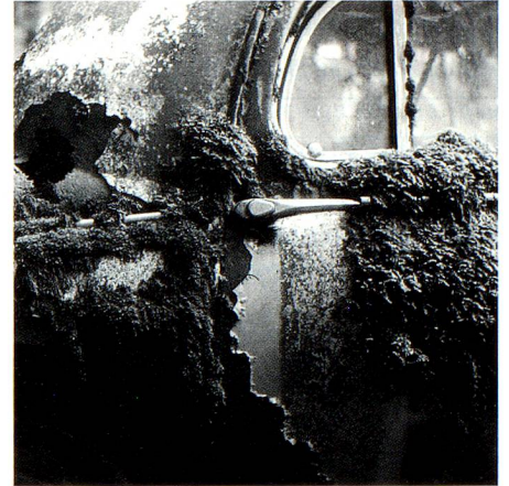
Cementerio de coches de Gürbetal, BE (página 7).