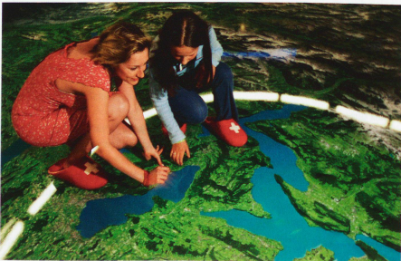
Panorama de Suiza.