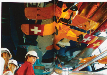
La historia de la aviación.