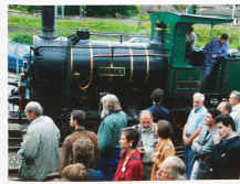
Una meca para los amantes del ferrocarril.