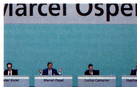
Fotos de prensa del año 2008: La última asamblea general de UBS con Marcel Ospel