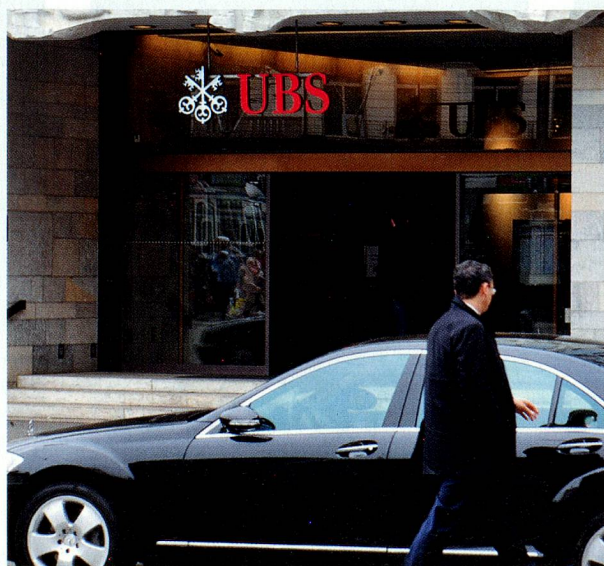
Como centro financiero, Suiza sufre las repercusiones de la crisis de la UBS.

A finales del otoño de 2008, la situación de la UBS era crítica. Otros bancos sólo le prestaban ya dinero a corto plazo, al final como máximo de un día para otro. Y cada vez más clientes retiraban su patrimonio del banco. La desesperada búsqueda de la directiva del banco, que necesitaba poderosos socios capitalistas privados, resultó infructuosa. El último recurso era el Estado: En tres cartas dirigidas al Consejo Federal, al Banco Nacional y al Consejo Regulador Bancario, el presidente del Consejo de Administración de la UBS solicitó ayuda financiera por valor de hasta 68 mil millones de francos – se trataba del reconocimiento de un gigantesco fracaso. El paquete de rescate de miles de millones de la Confederación y el Banco Nacional se componía de: 6000 millones de francos (reembolsables) de nuevo capital propio de la Confederación y hasta 60 mil millones de dólares del Banco Nacional (contra la asunción de títulos crediticios estadounidenses imposibles de convertir en valores