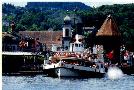
Barco de vapor de la flota del Lago de los Cuatro Cantones, en el embarcadero junto a la estación de Lucerna.

En www.MySwitzerland.com/aso , Suiza Turismo presenta diversas ofertas para estancias cortas y de más larga duración en Suiza. Estas extraordinarias ofertas tienen un descuento de hasta el 35% y están disponibles con regularidad.