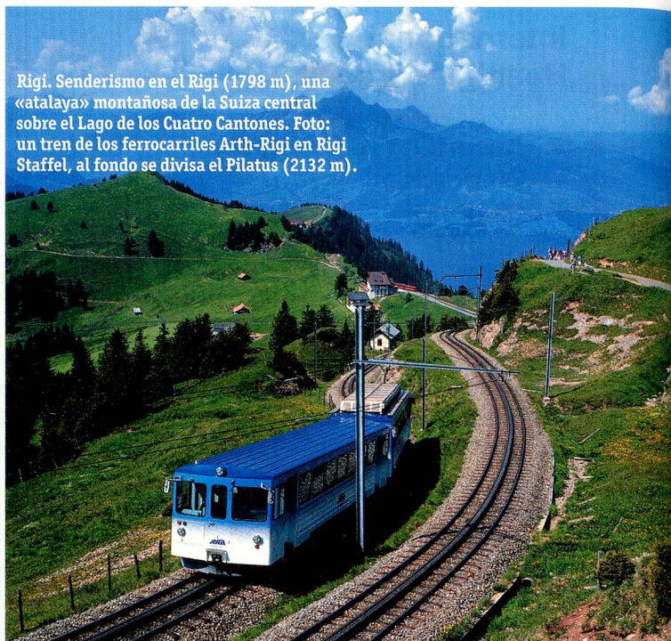
Rigi. Senderismo en el Rigi (1798 m), una «atalaya» montañosa de la Suiza central sobre el Lago de los Cuatro Cantones. Foto: un tren de los ferrocarriles Arth-Rigi en Rigi Staffel, al fondo se divisa el Pilatus (2132 m).