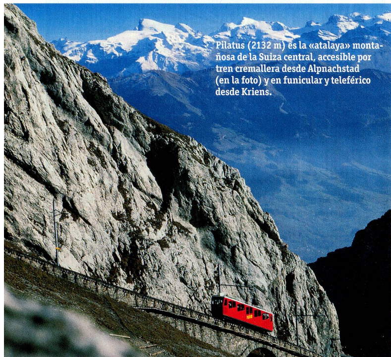
Pilatus (2132 m) es la «atalaya» montañosa de la Suiza central, accesible por tren cremallera desde Alpnachstad (en la foto) y en funicular y teleférico desde Kriens.