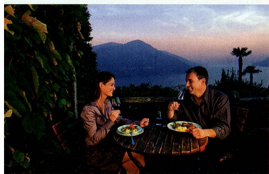
Grotto (restaurante rural típico tesinés) en el cantón del Tesino.

Fondue, raclette, «zürcher geschnetzeltes»: ¿Quién no conoce los iconos de la cocina suiza, casi tan famosos como el Monte Cervino? Y sin embargo en Helvetia quedan muchos otros manjares por descubrir. Suiza tiene una de las cocinas más variadas del mundo – Desde el plato bernés de entremeses con rösti al salchichón de la Suiza francesa, los capuns de la Engadina o la polenta tesinesa con brasato: cada región tiene una auténtica especialidad propia. Y en el Jauja suizo no solamente hay cocina tradicional de primerísima calidad, aquí se prensan asimismo uvas de la mejor calidad para elaborar excelentes vinos, se destilan licores de primera clase e incluso el agua es exquisita. No olvidemos las artísticas creaciones de sus cocineros estrella. En ninguna otra parte del mundo hay una densidad similar de restaurantes de alto rango como en este país con cuatro lenguas y cuatro culturas.