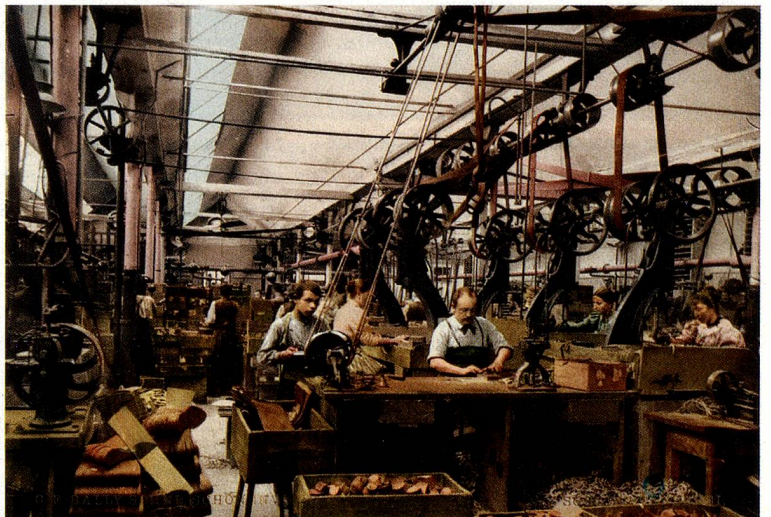
Carpintería de la fábrica de calzado C.F. Bally en Schö- nenwerd, en torno a 1900