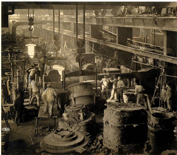
Taller de fundición de Sulzer en Winterthur, 1919