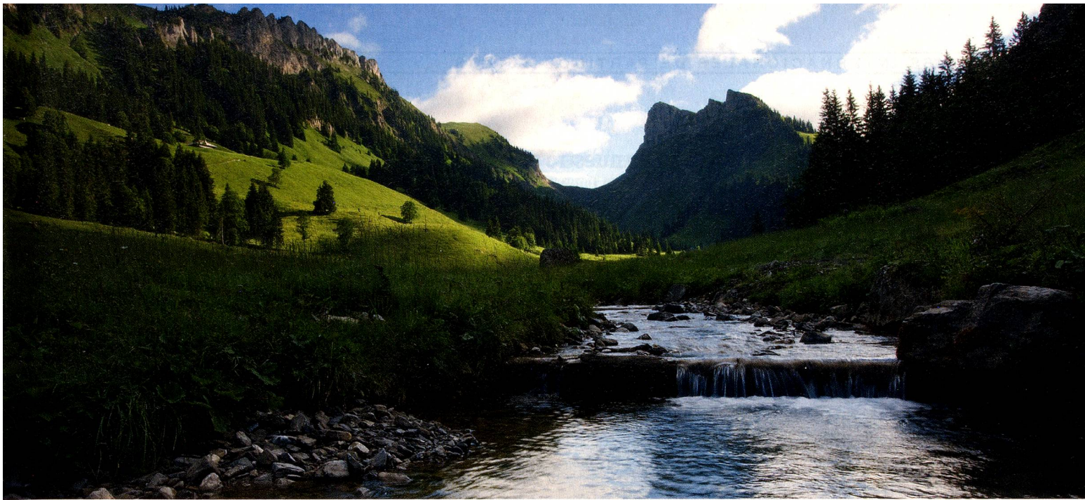
Justistal, parque natural de Thunersee-Hohgant, Oberland bernés