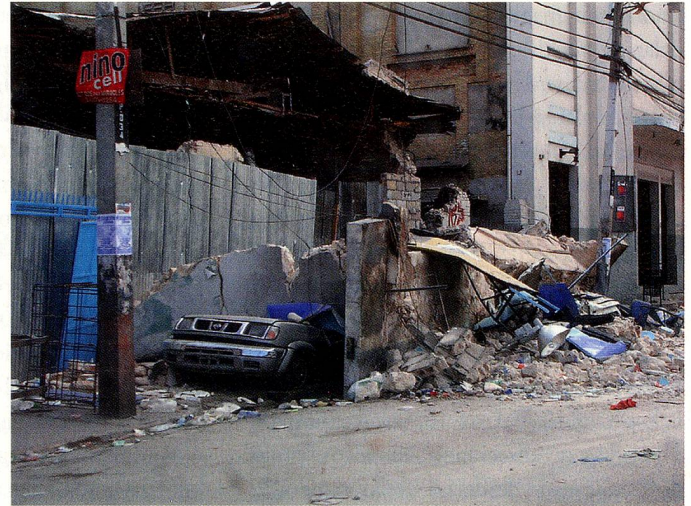
Pese a las grandes dificultades, el DFAE logró ayudar eficazmente a los suizos