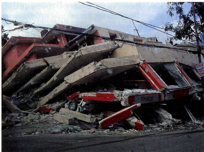
afectados por el terremoto de Haití.