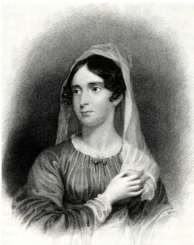
Anne Isabella Noel Byron (1792-1860), esposa de Lord Byron

El 17 de septiembre, Byron emprende un viaje en el Oberland bernés con dos amigos ingleses. Pasan Les Avants (sobre Montreux), el puerto de Jaman, el valle del Simme, Thun, Interlaken, y llegan a Lauterbrunnen, pueblo escondido entre las cumbres, donde vertiginosos acantilados se cubren con torrentes que caen al vacío. Las cataratas de Staubbach retienen largamente su atención: «El torrente se repliega sobre la roca como la cola de un caballo blanco que ondea al viento»*. Al pasar por los Alpes de Wengern el poeta se queda contemplando el Eiger, el Mönch y el Jungfrau, desplegando todo su