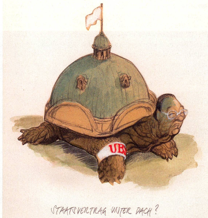
Pacto estatal a cubierto

PETER GUT, nacido en 1959, es uno de los caricaturistas más notables de Suiza y trabaja regularmente para el periódico «Neue Zürcher Zeitung» y otras publicaciones. Ilustramos el artículo sobre Suiza como centro financiero con sus comentarios en forma de dibujos sobre el caso de la UBS y la crisis financiera.