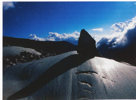
Glaciar del Ródano