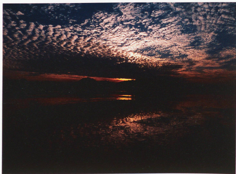
Lago de Zug

cuentra y fotografía es asombroso y muy a menudo totalmente distinto de las impresiones ópticas que tenemos habitualmente de Suiza. Son fotos de Suiza que nos trasladan ópticamente al vasto mundo exterior.