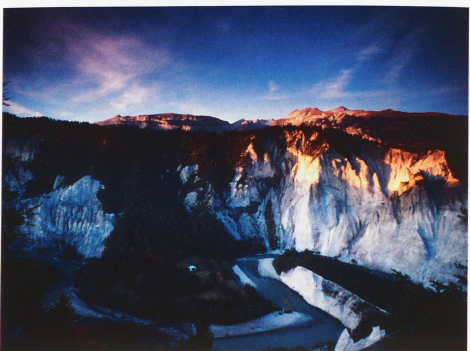
Garganta del Rin