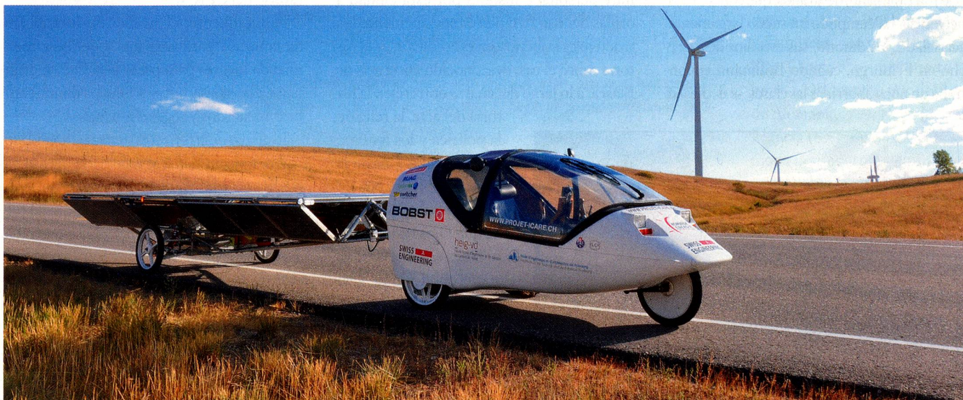
El reconvertido Twike llamado «Icarette» es propulsado por energía solar y eólica

Producción académica: 2 trabajos de diplomatura (bachelor), 10 trabajos de fin de semestre, 2 universidades colaboradoras en el proyecto, cientos de horas de investigación Tiempo de espera para pasar las aduanas: En Perú, 2 horas, en Túnez, 4 horas, en Marruecos, 6 horas, en Ecuador, 13 días, en Estados Unidos, 2 meses.